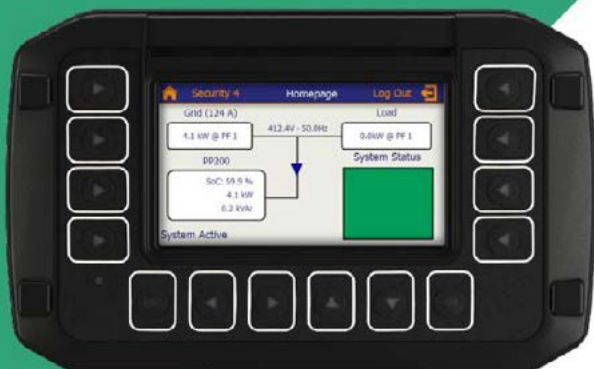
Tableau de commande